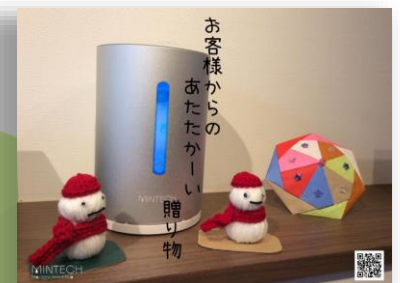
MINTECH 水素発生器 MT-A100

編集後記 あけましておめでとございます。みなさま輝かしい新春をお迎えのことと存じます。本年も水素吸入生活の普及を目指して、水素のよさをどんどんお伝えしていこうと思っております。今年もどうぞよろしくお願いたします。(田)